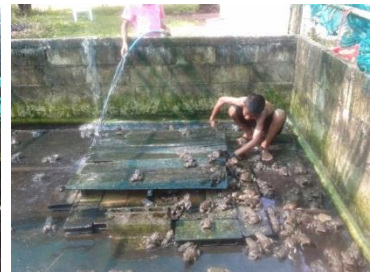
ภาพประกอบ 8 แหล่งเรียนรู้การเกษตรก่อนและหลังการดำเนินการพัฒนา