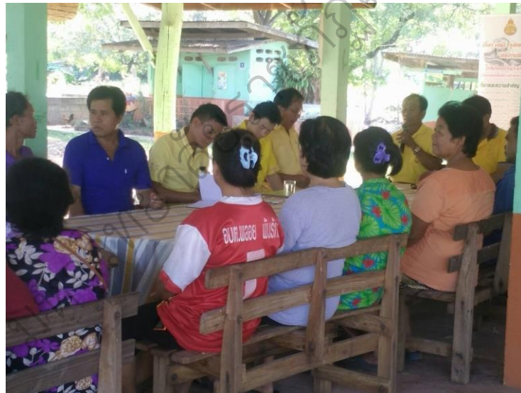
ภาพประกอบ 3 ประชุมวางแผน ชี้แจงการทำงานวิจัยแก่ผู้ร่วมวิจัยร่วมกันคิด วิเคราะห์ เกี่ยวกับสภาพและปัญหาเกี่ยวกับแหล่งเรียนรู้