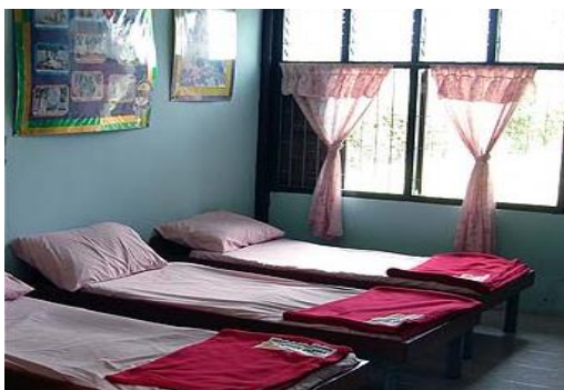
ภาพประกอบ 7 ห้องพยาบาลก่อนและหลังการดำเนินการพัฒนา