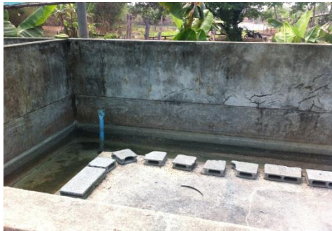
หลังการพัฒนา