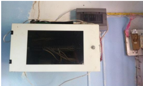
ภาพประกอบ 6 ห้องคอมพิวเตอร์ก่อนและหลังการดำเนินการพัฒนา