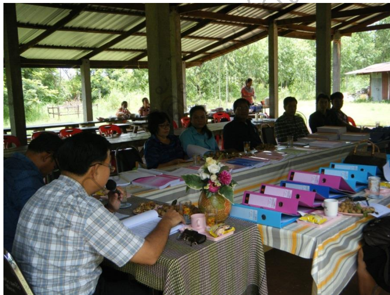
ภาพประกอบ 4 ประชุมเชิงปฏิบัติการ เพื่อพัฒนาแหล่งเรียนรู้ วันที่ 19 สิงหาคม 2557