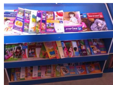
ภาพประกอบ 5 ห้องสมุดก่อนและหลังการดำเนินการพัฒนา