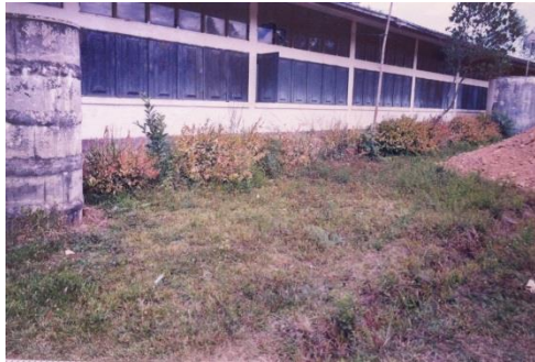
ก่อนการพัฒนา