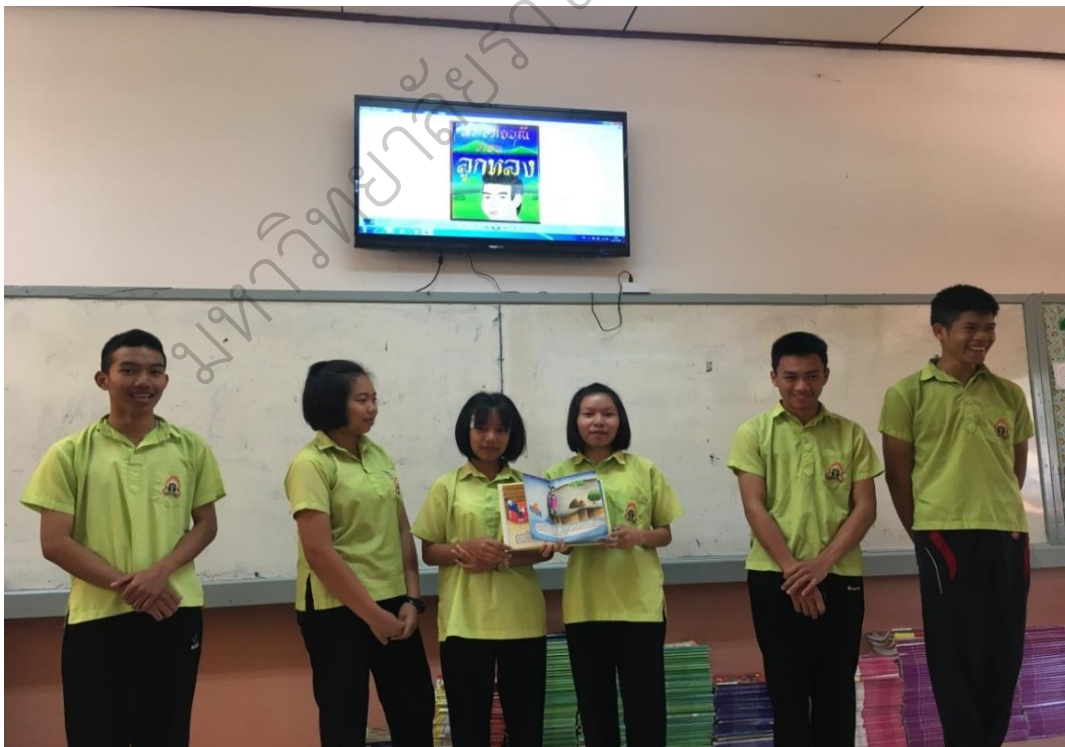
ภาพประกอบ 6 นักเรียนนำเสนอผลงาน