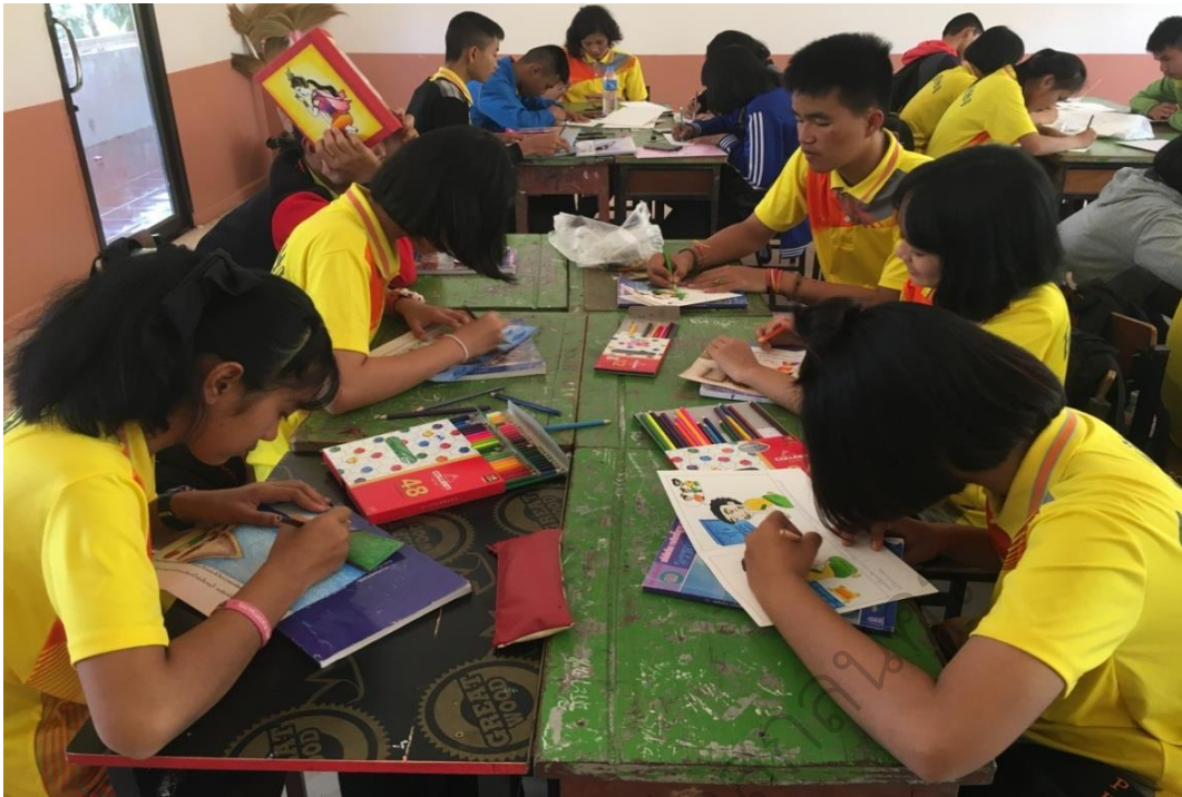
ภาพประกอบ 5 นักเรียนทำงานกลุ่ม