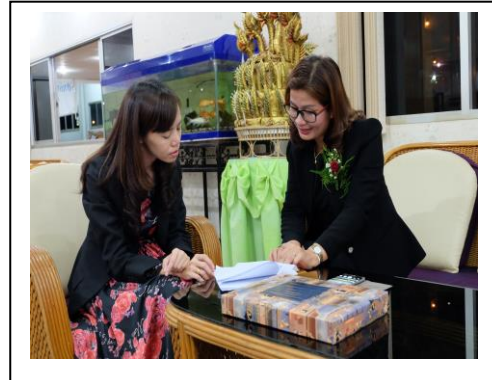
ภาพประกอบ 18 ศึกษาความเหมาะสมขององค์ประกอบโดยการสัมภาษณ์เชิงลึก ผู้อำนวยการโรงเรียนบ้านปลวกธาตุโสภาวิทยา จังหวัดสกลนคร