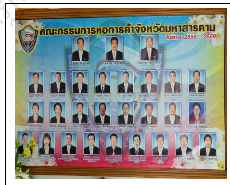
ภาพประกอบ 19 ศึกษาความเหมาะสมขององค์ประกอบโดยการสัมภาษณ์เชิงลึก ประธานหอการค้า จังหวัดมหาสารคาม (ตัวแทนฯ)