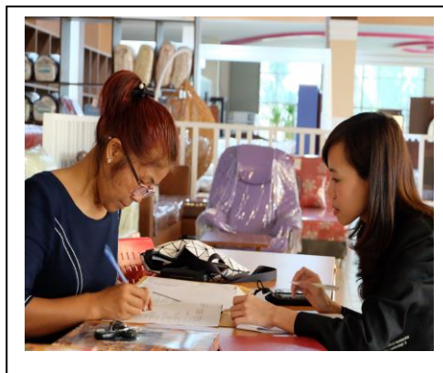
ภาพประกอบ 16 ศึกษาความเหมาะสมขององค์ประกอบโดยการสัมภาษณ์เชิงลึก ผู้ประกอบการบริษัทเป็นหนึ่งเฟอร์นิเจอร์ จำกัด จังหวัดเลย