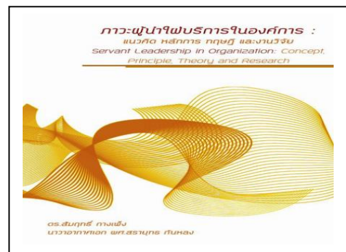
ภาพประกอบ 14 ศึกษาความเหมาะสมขององค์ประกอบโดยการสัมภาษณ์เชิงลึก ดร.สัมฤทธิ์ กางเพ็ง