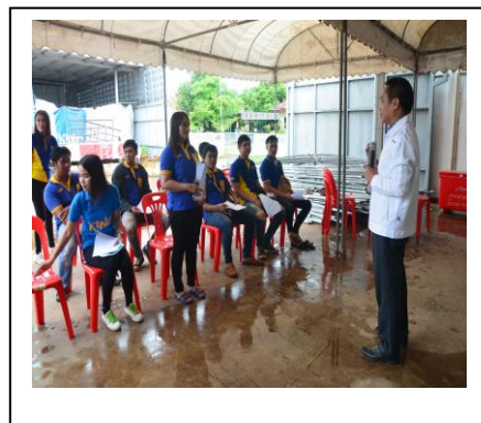
ภาพประกอบ 20 กิจกรรมการพัฒนาตามโครงการพัฒนาภาวะผู้นำไฟบริการของ นักศึกษาฝึกงานในบริษัทจำหน่ายเฟอร์นิเจอร์ ในภาคตะวันออกเฉียงเหนือ