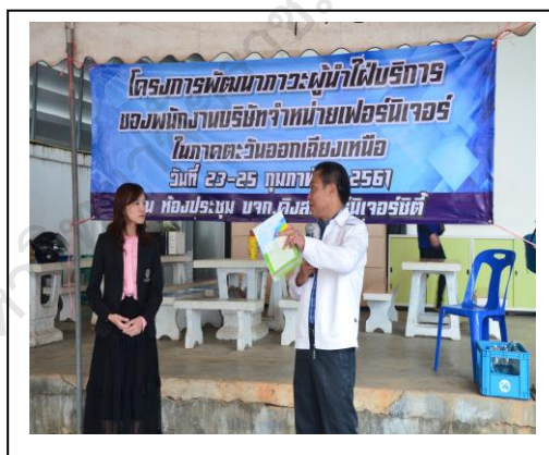
ภาพประกอบ 21 ร่วมเป็นวิทยากรในการพัฒนาตามโครงการพัฒนาภาวะผู้นำไฟบริการ ของนักศึกษาฝึกงานในบริษัทจำหน่ายเฟอร์นิเจอร์ ในภาคตะวันออกเฉียงเหนือ