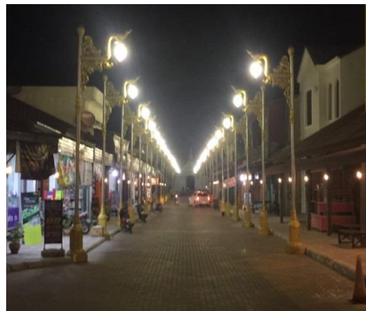
ภาพประกอบ 42 การดำเนินโครงการ/ กิจกรรมเศรษฐกิจพิเศษจังหวัดนครพนม