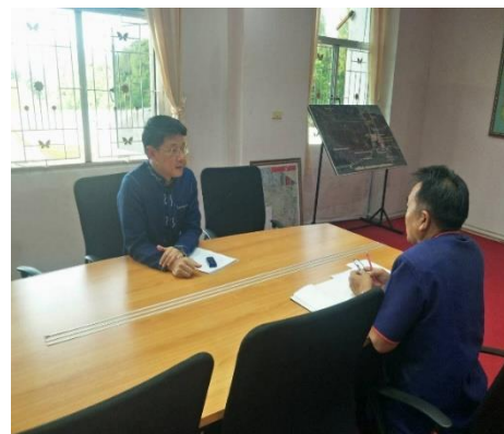
ภาพประกอบ 41 ผู้วิจัยสอบถามปัจจัยที่เอื้ออำนวยต่อการพัฒนาจังหวัดนครพนม