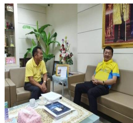
ภาพประกอบ 40 ผู้ทรงวุฒิให้ข้อมูลการพัฒนาจังหวัดนครพนมจากอดีตจนถึงปัจจุบัน