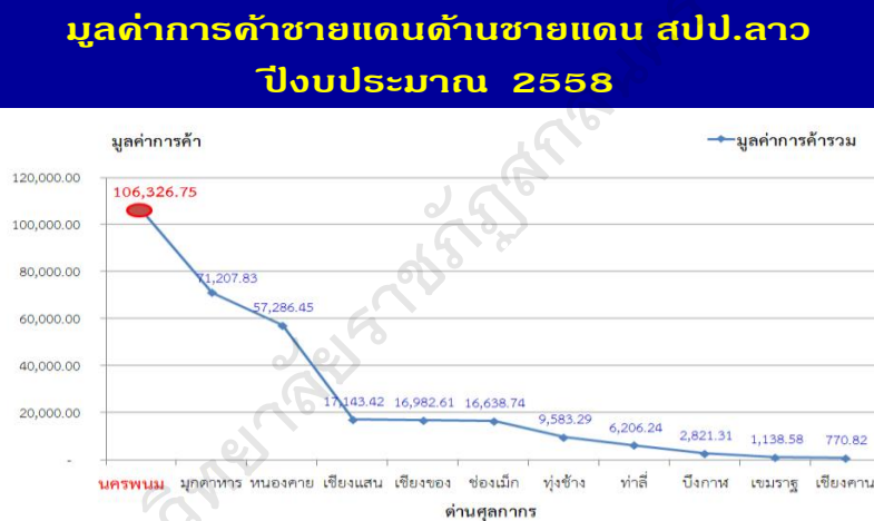
ภาพประกอบ 1 มูลค่าการค้าชายแดนไทยกับสาธารณรัฐประชาธิปไตยประชาชนลาว (2562, หน้า 8)

จากสถิติมูลค่าการค้าชายแดนของจังหวัดนครพนมตั้งแต่ปี 2553-2558 จะเห็นได้ว่ามูลค่าการค้าเพิ่มขึ้นทุกปี โดยเพิ่มขึ้นอย่างก้าวกระโดดในปี 2556 ภายหลังสะพานมิตรภาพแห่งที่ 3 เปิดดำเนินการ โดยสินค้าส่งออกที่สำคัญ ได้แก่ สินค้าส่วนประกอบคอมพิวเตอร์ เครื่องดื่มชูกำลังและสินค้าการเกษตรแปรรูปเมื่อเปรียบเทียบมูลค่าการค้าชายแดนระหว่าง 3 จังหวัด ที่มีสะพานข้ามแม่น้ำโขง ได้แก่ หนองคาย มุกดาหารและนครพนม พบว่า การค้าของนครพนมเพิ่มขึ้นอย่างรวดเร็ว มีมูลค่าถึง 87,104.96 ล้านบาทในปี 2557 สะท้อนถึงศักยภาพด้านการค้าชายแดนที่ได้เปรียบจังหวัดอื่น ๆ โอกาส