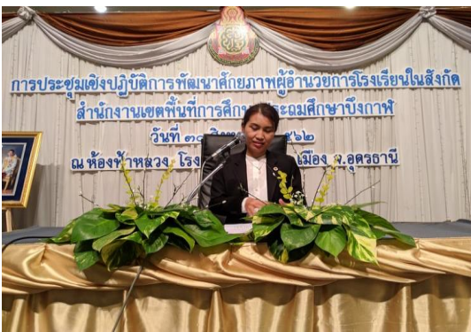
ภาพประกอบ 7 การประชาสัมพันธ์โดยผู้บริหารสถานศึกษา สังกัดสำนักงานเขตพื้นที่การศึกษาประถมศึกษาบึงกาฬ