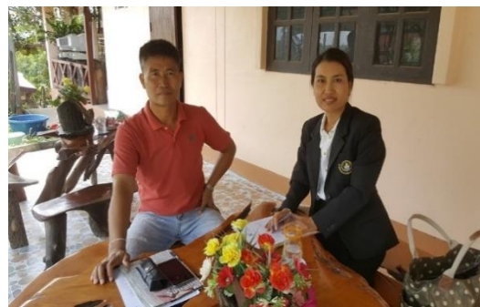
ภาพประกอบ 6 การสัมภาษณ์ผู้ทรงคุณวุฒิ