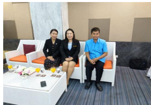
ภาพประกอบ 6 การสัมภาษณ์ผู้ทรงคุณวุฒิ (ต่อ)