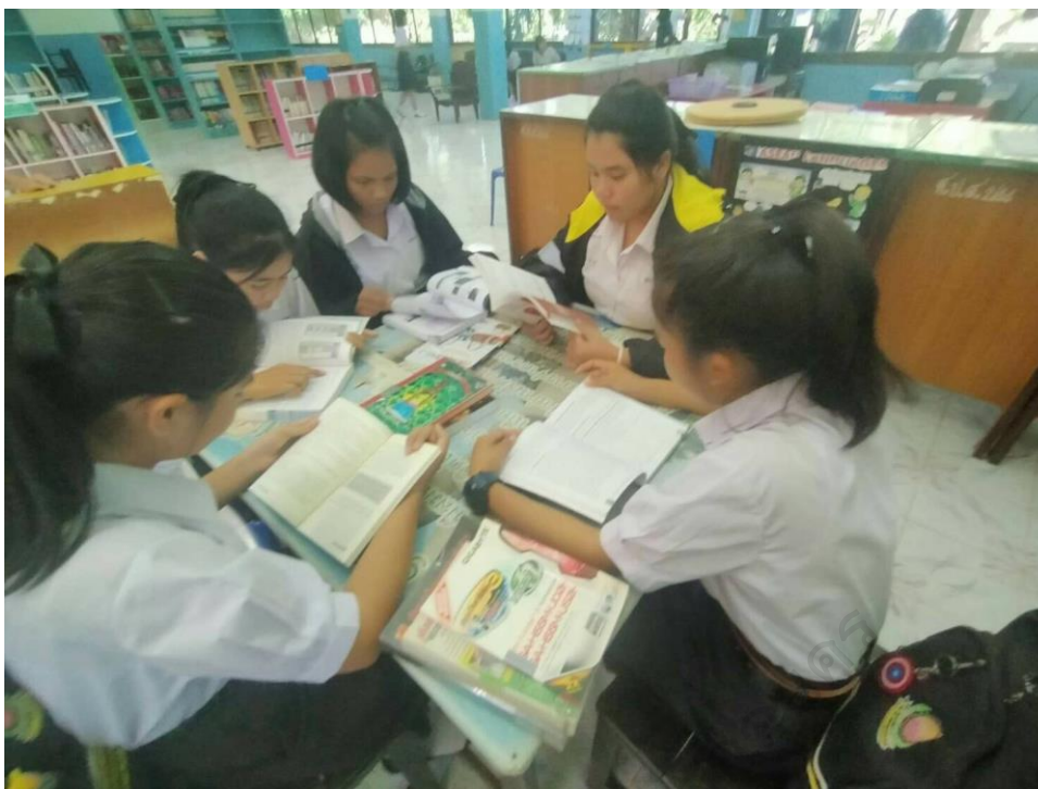
ภาพประกอบ 15 การศึกษา ค้นคว้าข้อมูลจากห้องสมุด