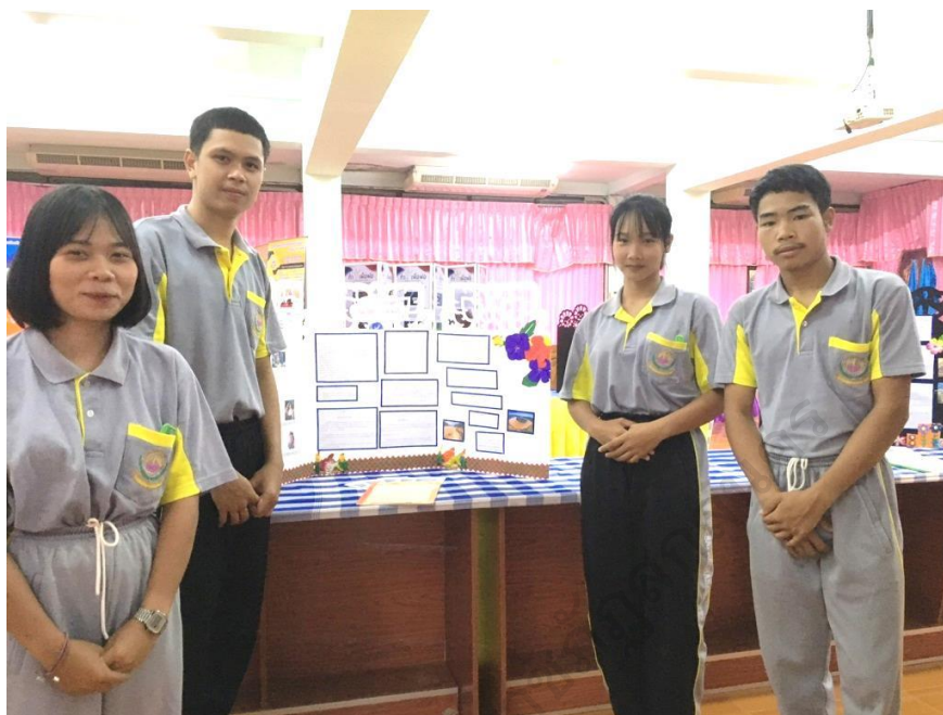
ภาพประกอบ 19 การนำเสนอผลงานโครงงานทางประวัติศาสตร์ของผู้เรียน

(นักเรียนเลขที่ 11, สะท้อนความคิดเห็น, 18 กรกฎาคม 2562)