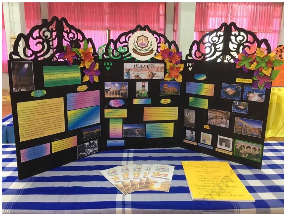
ภาพประกอบ 22 ตัวอย่างการแสดงผลงานโครงการของผู้เรียน

จากที่กล่าวมาจะเห็นได้ว่า การจัดกิจกรรมการเรียนรู้วิชาประวัติศาสตร์ เรื่อง อารยธรรมของโลกยุคโบราณ ตามแนวคิดการเรียนรู้แบบโครงงานเป็นฐาน สำหรับนักเรียนชั้นมัธยมศึกษาปีที่ 5 ได้ช่วยพัฒนาทักษะการใช้ภาษาทั้ง 4 ด้าน คือ ทักษะด้านการฟัง ทักษะด้านการพูด ทักษะด้านการอ่าน และทักษะด้านการเขียนได้เป็นอย่างดี ซึ่งผู้เรียนสามารถนำความรู้ไปใช้การพัฒนาตนเองในด้านการศึกษา ตลอดจนประยุกต์ใช้ในการดำเนินชีวิตประจำวันได้อย่างเหมาะสม