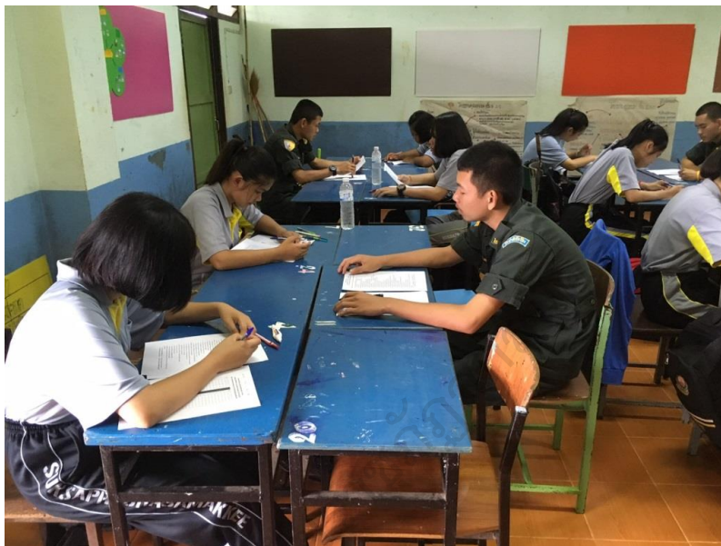
ภาพประกอบ 16 นักเรียนแต่ละกลุ่มช่วยกันระดมความคิด และวางแผนทำงานภายในกลุ่ม

(นักเรียนเลขที่ 15, สะท้อนความคิดเห็น, 4 กรกฎาคม 2562)