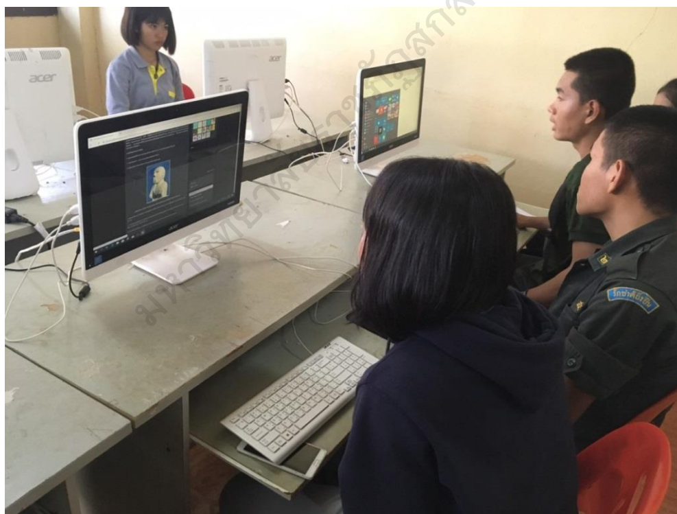
ภาพประกอบ 14 การศึกษาค้นคว้า และสืบค้นข้อมูลจากอินเทอร์เน็ต

(นักเรียนเลขที่ 5, สะท้อนความคิดเห็น, 28 มิถุนายน 2562)