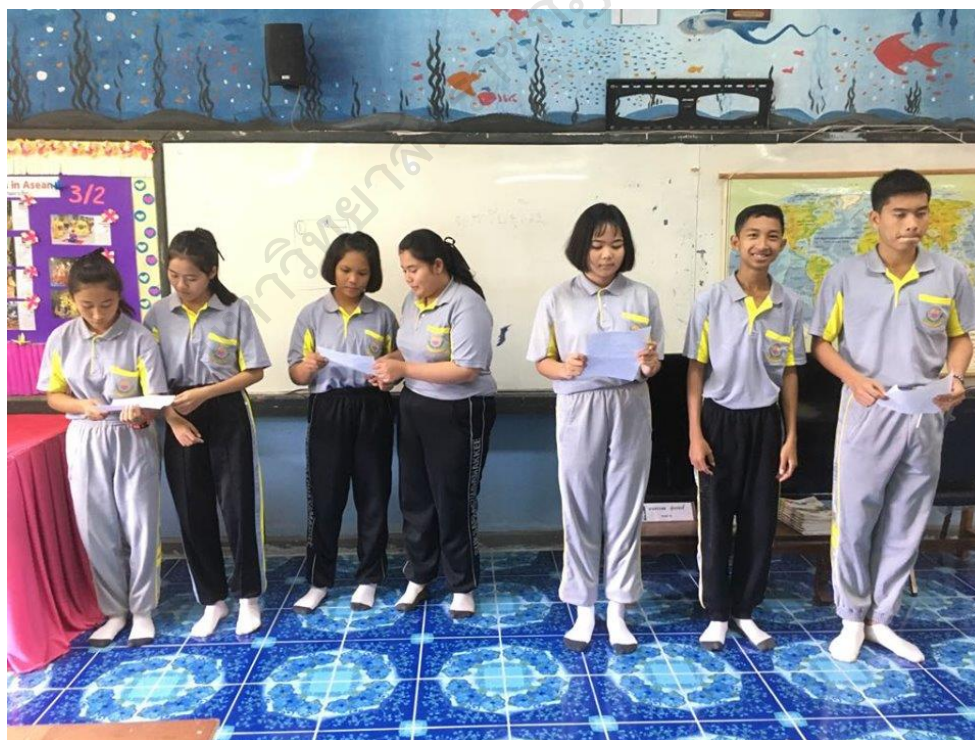
ภาพประกอบ 20 การส่งเสริมทักษะด้านการอ่านให้กับผู้เรียน

(นักเรียนเลขที่ 15, สะท้อนความคิดเห็น, 18 กรกฎาคม 2562)