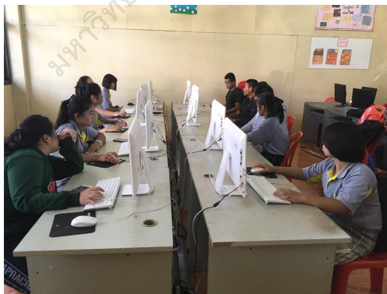
ภาพประกอบ 17 นักเรียนแต่ละกลุ่มช่วยกัน ศึกษาค้นคว้าข้อมูลจากอินเทอร์เน็ต