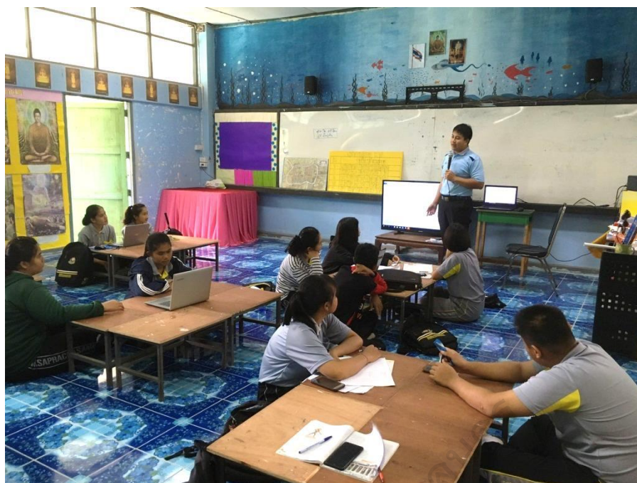
ภาพประกอบ 18 การฝึกทักษะด้านการฟังให้แก่ผู้เรียน