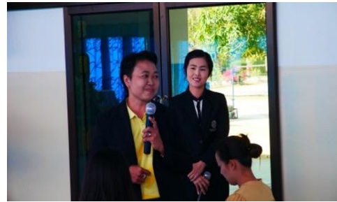
ผู้เข้ารับการอบรม