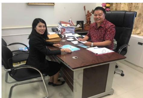
ผู้เชี่ยวชาญตรวจสอบเครื่องมือการวิจัย

คณะกรรมการบริหารหลักสูตรครุศาสตรมหาบัณฑิตและหลักสูตรปรัชญาดุษฎีบัณฑิต สาขาวิชาการบริหารการศึกษา มหาวิทยาลัยราชภัฏสกลนคร