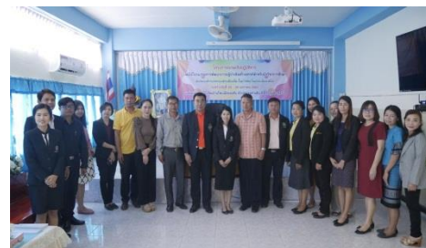
วิทยากรถ่ายภาพร่วมกับผู้รับการอบรม

ภาพประกอบ 4 การอบรมเชิงปฏิบัติการโดยใช้ โปรแกรมการพัฒนาภาวะผู้นำ เชิงสร้างสรรค์สำหรับนักวิชาการศึกษา สังกัดองค์กรปกครองส่วนท้องถิ่น ในภาคตะวันออกเฉียงเหนือ