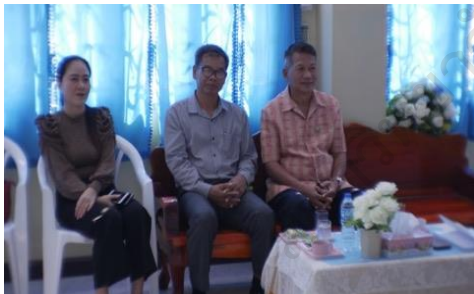
แขกผู้มีเกียรติ