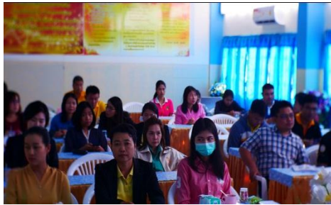
ผู้เข้ารับการอบรม