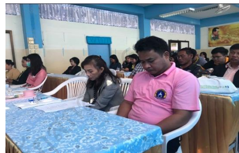
ผู้เข้ารับการอบรม