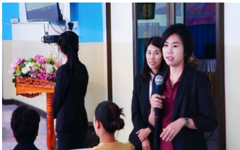
ผู้เข้ารับการอบรม