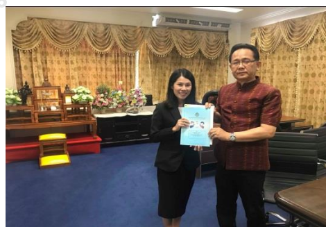
ผู้เชี่ยวชาญตรวจสอบเครื่องมือการวิจัย

ผู้อำนวยการกลุ่มงานส่งเสริมและพัฒนาท้องถิ่น