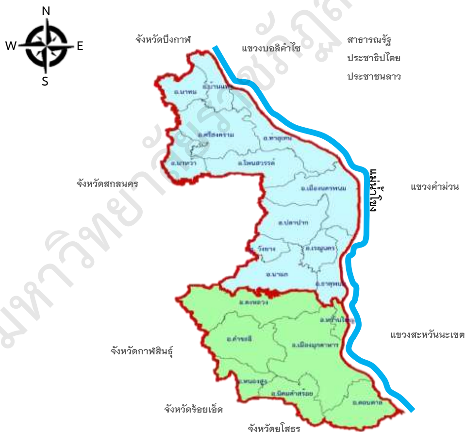
ภาพประกอบที่ 2 พื้นที่ครอบคลุมจังหวัดของสพม.22

ทิศตะวันตก ติดต่อกับอำเภอเขาวง อำเภอภูมินารายณ จังหวัดกาฬสินธุ์และอำเภอเมยวดี จังหวัดร้อยเอ็ด