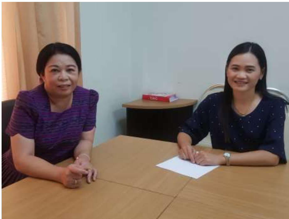
ภาพประกอบ 4 การสัมภาษณ์ผู้เชี่ยวชาญ ตำแหน่ง คีษานีเทศก์