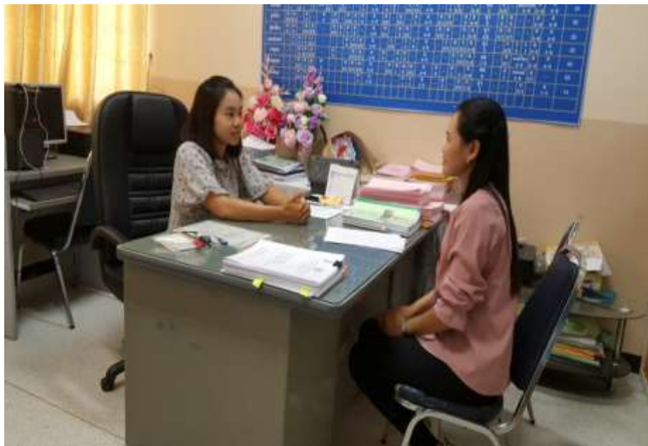
ภาพประกอบ 3 การสัมภาษณ์ผู้เชี่ยวชาญ ตำแหน่ง ผู้บริหารสถานศึกษา