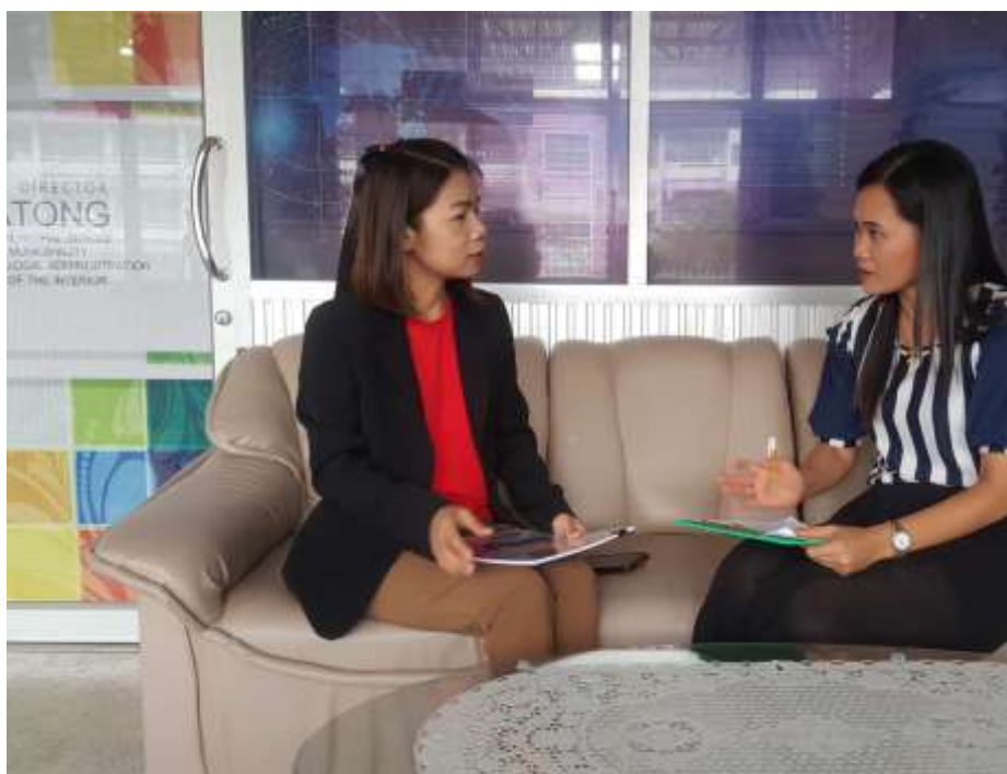
ภาพประกอบ 2 การสัมภาษณ์ผู้เชี่ยวชาญ ตำแหน่ง ครูผู้สอน