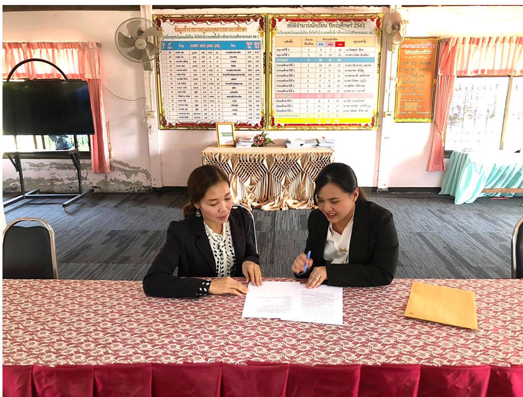
ภาพประกอบ 5 การสัมภาษณ์ผู้เชี่ยวชาญที่เป็นครูผู้สอน