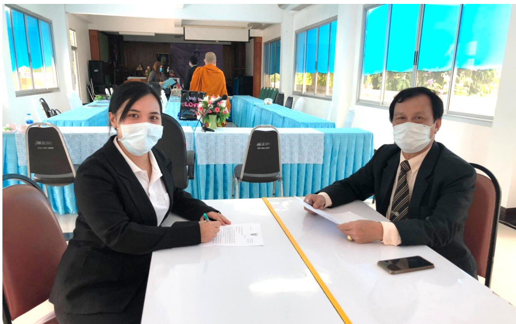
ภาพประกอบ 3 การสัมภาษณ์ผู้เชี่ยวชาญที่เป็นอาจารย์มหาวิทยาลัย