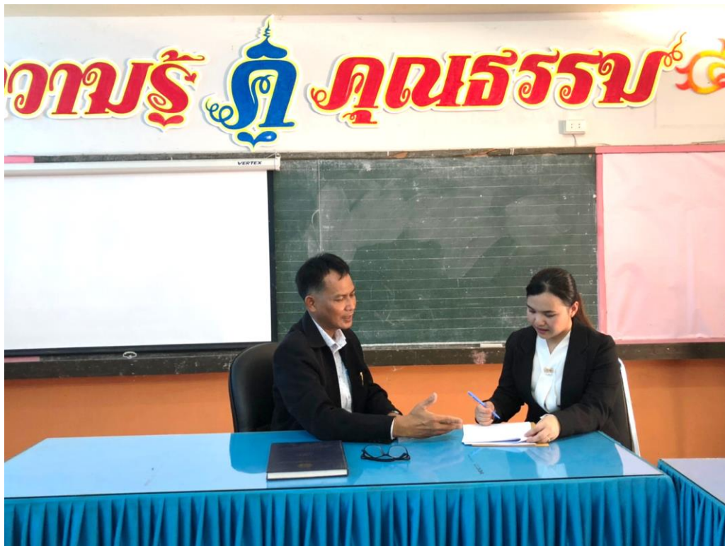
ภาพประกอบ 4 การสัมภาษณ์ผู้เชี่ยวชาญที่เป็นผู้บริหารสถานศึกษา