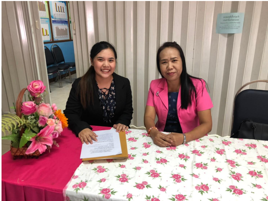
ภาพประกอบ 6 การสัมภาษณ์ผู้เชี่ยวชาญที่เป็นศึกษานิเทศก์