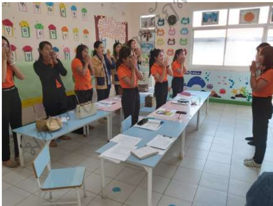
ภาพประกอบ 4 การอบรมเชิงปฏิบัติการเพื่อพัฒนาศักยภาพครูในการ จัดประสบการณ์การเรียนรู้เพื่อการเสริมสร้างพหุปัญญาของเด็กปฐมวัย กลุ่มเครือข่ายสถานศึกษาเอกชนมุกดาหาร สังกัดสำนักงานศึกษาธิการ จังหวัดมุกดาหาร