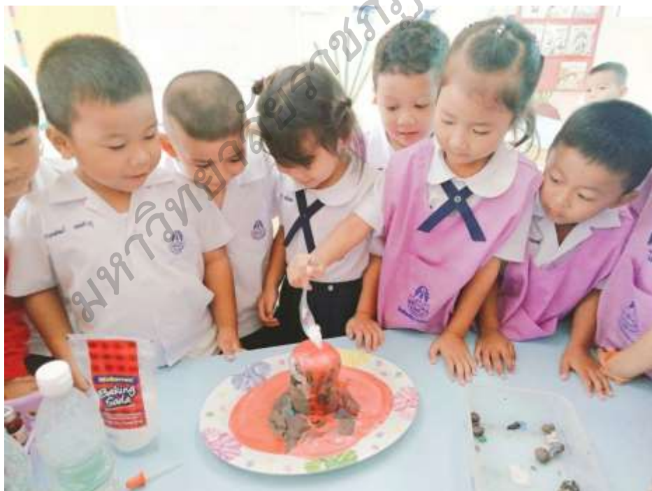
ภาพประกอบ 6 ตัวอย่างการจัดประสบการณ์การเรียนรู้เพื่อการเสริมสร้าง พหุปัญญาของเด็กปฐมวัย กลุ่มเครือข่ายสถานศึกษาเอกชนมุกดาหาร สังกัดสำนักงานศึกษาธิการจังหวัดจังหวัดมุกดาหาร