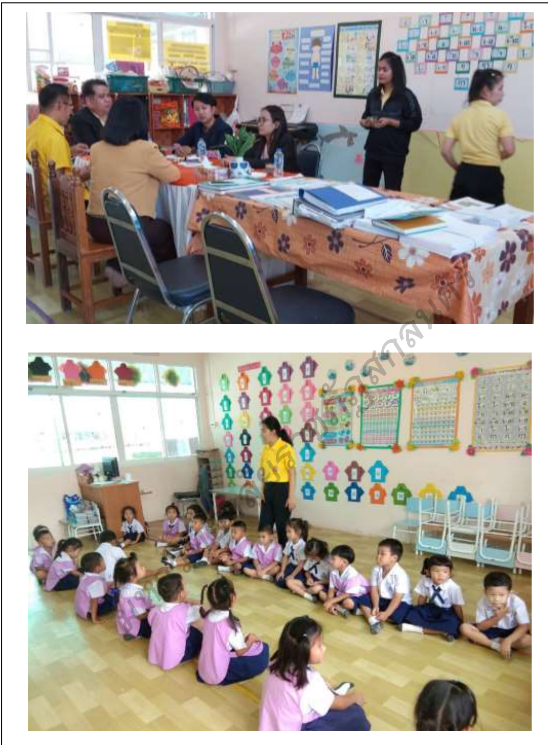
ภาพประกอบ 5 การนิเทศติดตามปฏิบัติการเพื่อพัฒนาศักยภาพครูในการ จัดประสบการณ์การเรียนรู้เพื่อการเสริมสร้างพหุปัญญาของเด็กปฐมวัย กลุ่มเครือข่ายสถานศึกษาเอกชนมุกดาหาร สังกัดสำนักงานศึกษาธิการ จังหวัดจังหวัดมุกดาหาร