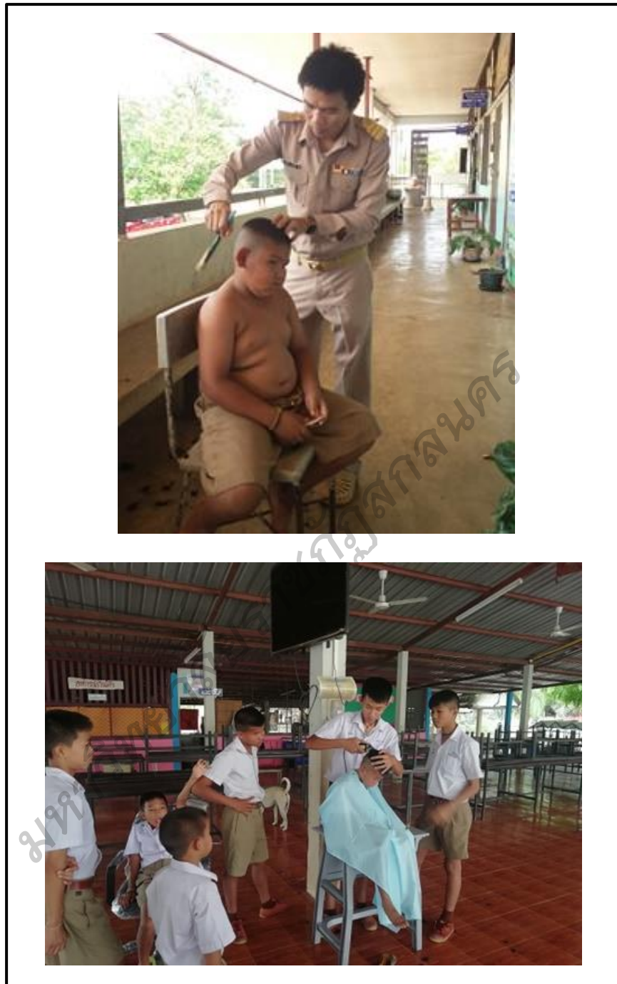
ภาพประกอบ 8 กิจกรรมสอนสอดแทรก เพื่อพัฒนาและให้นักเรียน มีระเบียบวินัยรู้จักตนเองและทำตนให้เป็นประโยชน์ต่อ ส่วนรวม