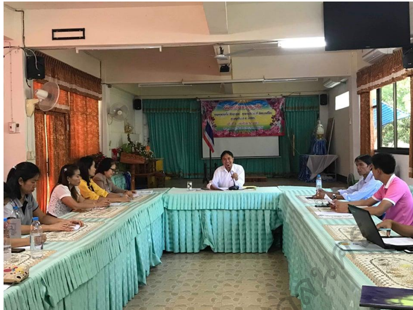
ภาพประกอบ 3 การประชุมกำหนดแผนปฏิบัติการพัฒนาศักยภาพครู ในการเสริมสร้างวินัยนักเรียน