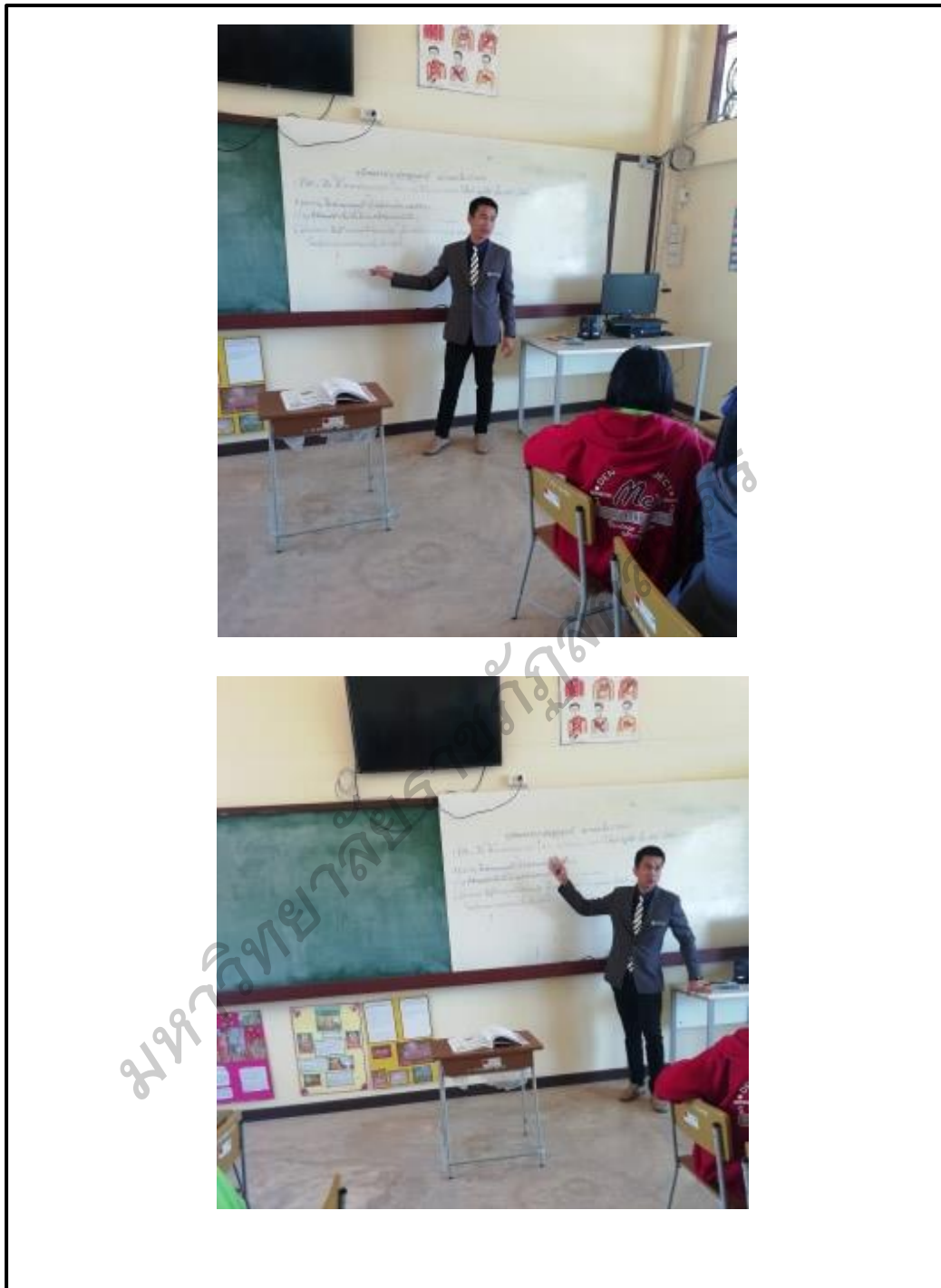
ภาพประกอบ 14 กิจกรรมพัฒนาผู้เรียนสอดแทรกความรับผิดชอบในวิชาเรียน