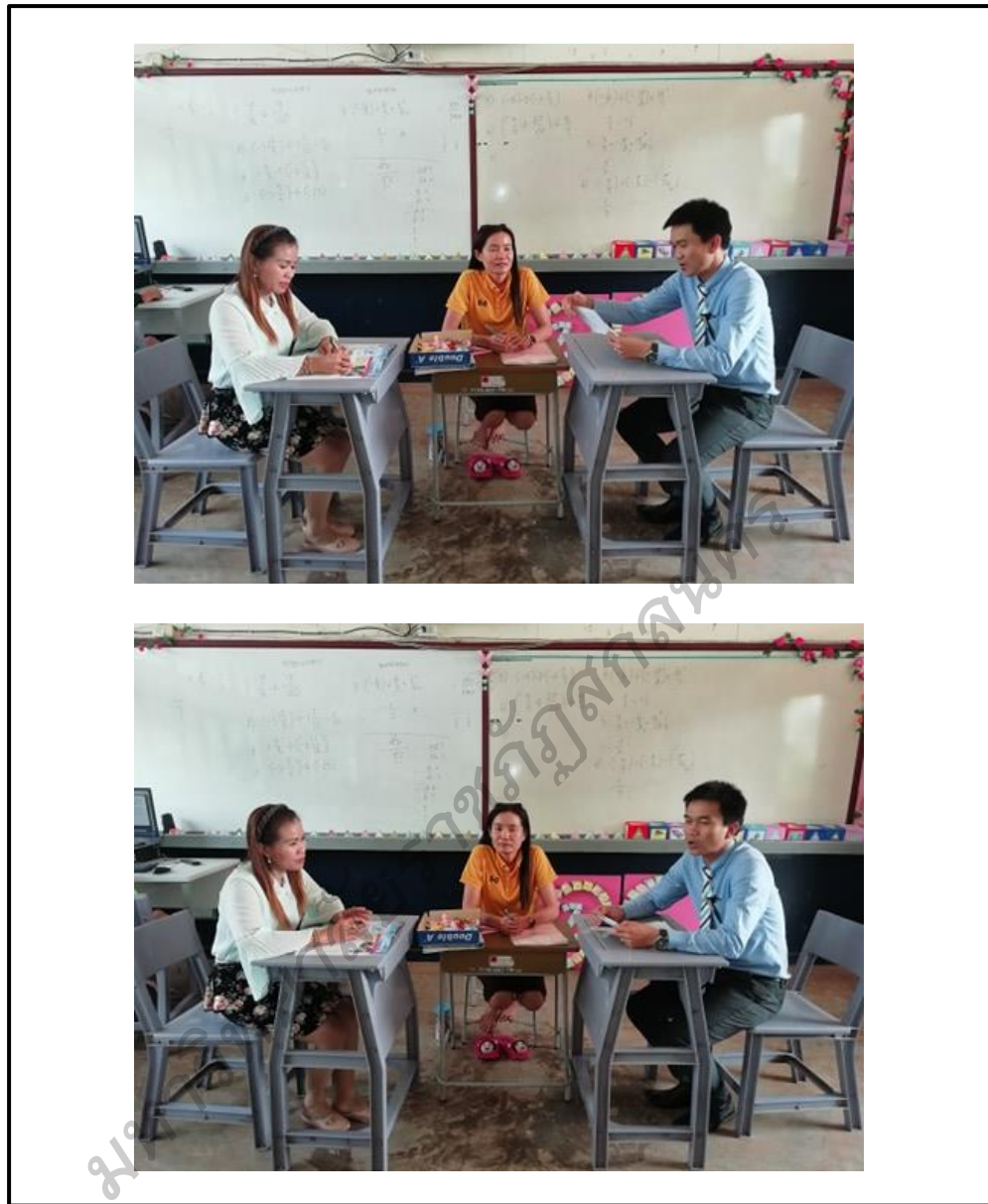
ภาพประกอบ 9 กิจกรรมชุมชนแห่งการเรียนรู้ทางวิชาชีพ