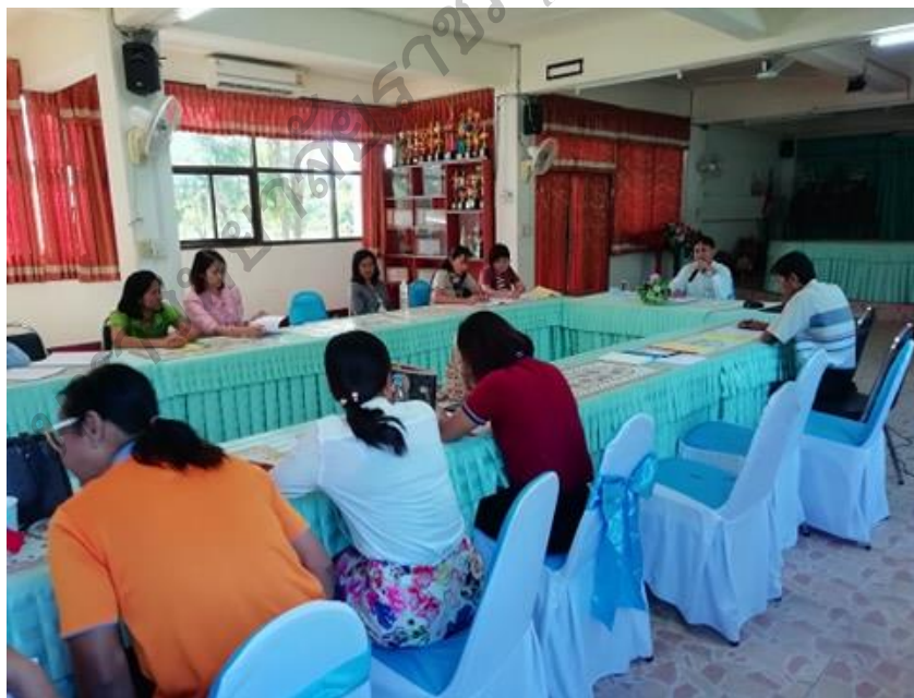
ภาพประกอบ 2 ประชุมวางแผนในการแจ้งการปฏิบัติการพัฒนาศักยภาพ ครูในการเสริมสร้างวินัยนักเรียน ณ โรงเรียนบ้านข่วงคสีชชาติ วันที่ 3 มกราคม พ.ศ. 2563