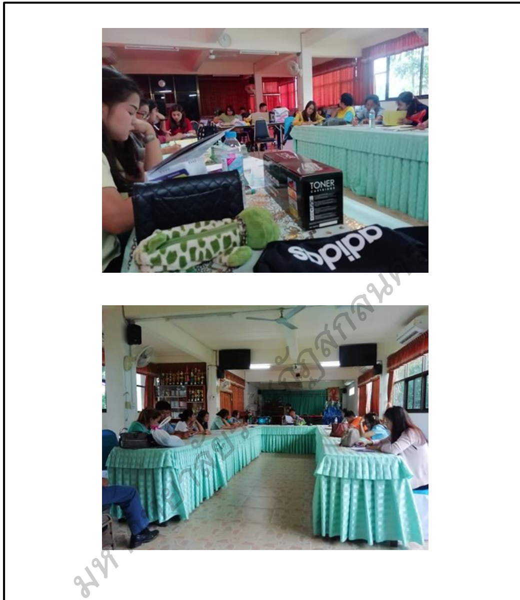
ภาพประกอบ 11 กิจกรรมชุมชนแห่งการเรียนรู้ทางวิชาชีพ