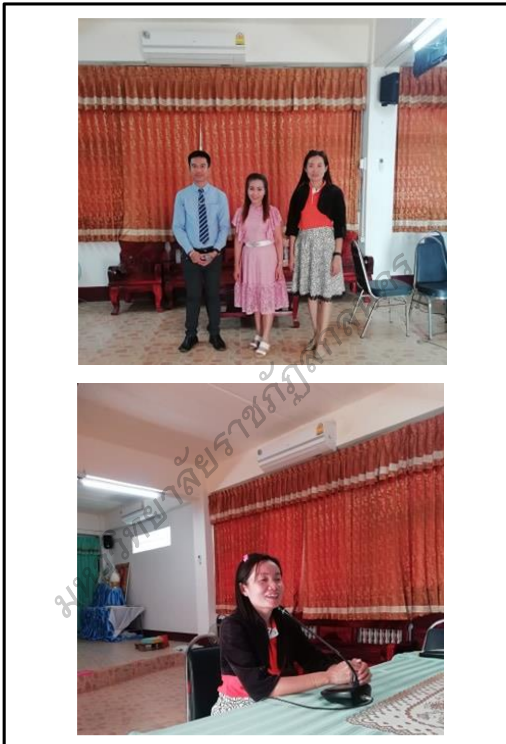
ภาพประกอบ 5 คณะวิทยากรเตรียมการประชุมเชิงปฏิบัติการเพื่อพัฒนา ศักยภาพครูในการเสริมสร้างวินัยนักเรียน