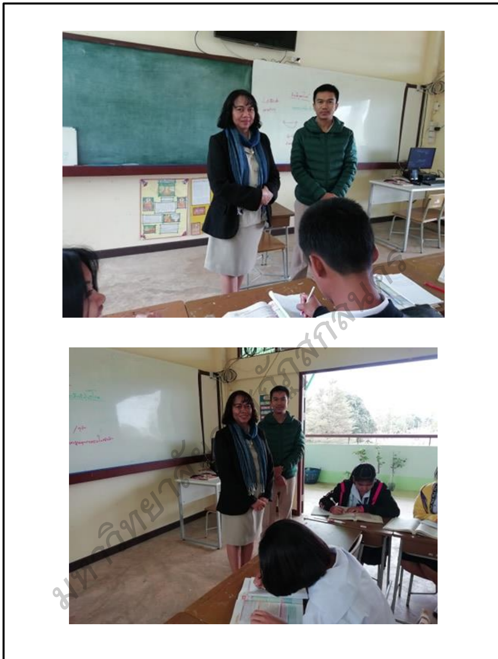
ภาพประกอบ 7 รับการนิเทศภายในโรงเรียนบ้านข่วงคลีชูชาติ โดย คณะกรรมการฝ่ายวิชาการของโรงเรียนเพื่อพัฒนา ศักยภาพครูในการเสริมสร้างวินัยนักเรียน