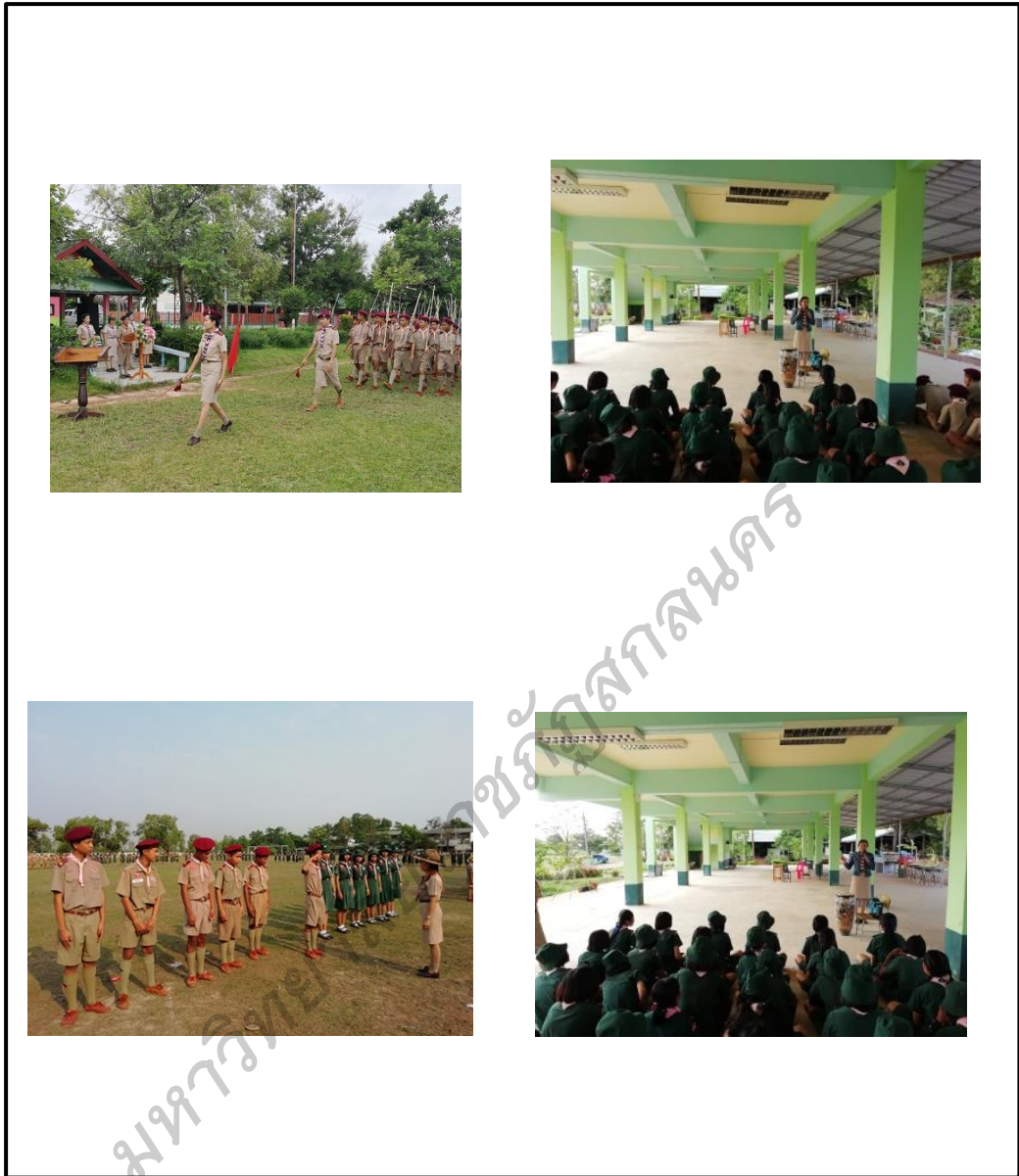
ภาพประกอบ 12 กิจกรรมพัฒนาผู้เรียนโดยใช้กิจกรรมลูกเสือ - ยุวกาชาด