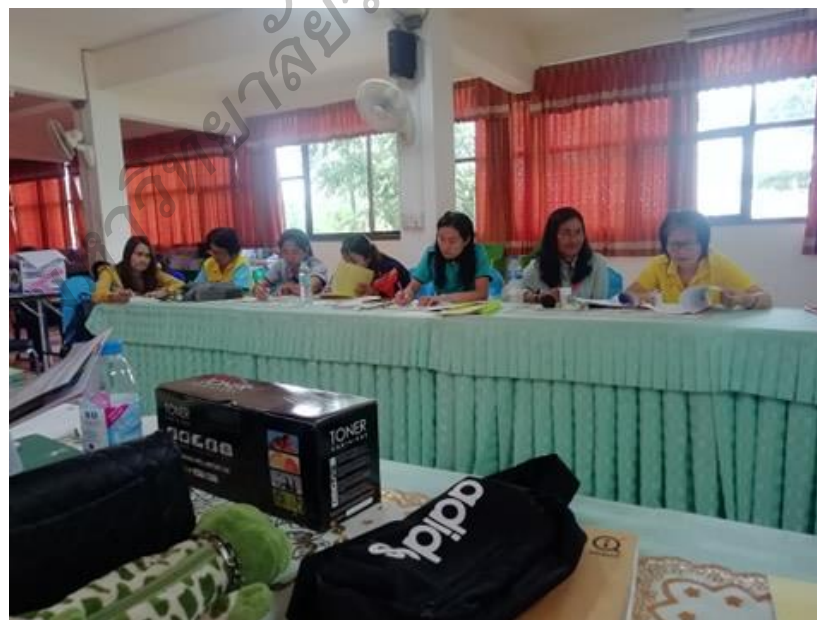
ภาพประกอบ 4 การประชุมกำหนดแนวทางเพื่อหาแนวทางการพัฒนา ศักยภาพครูในการเสริมสร้างวินัยนักเรียน