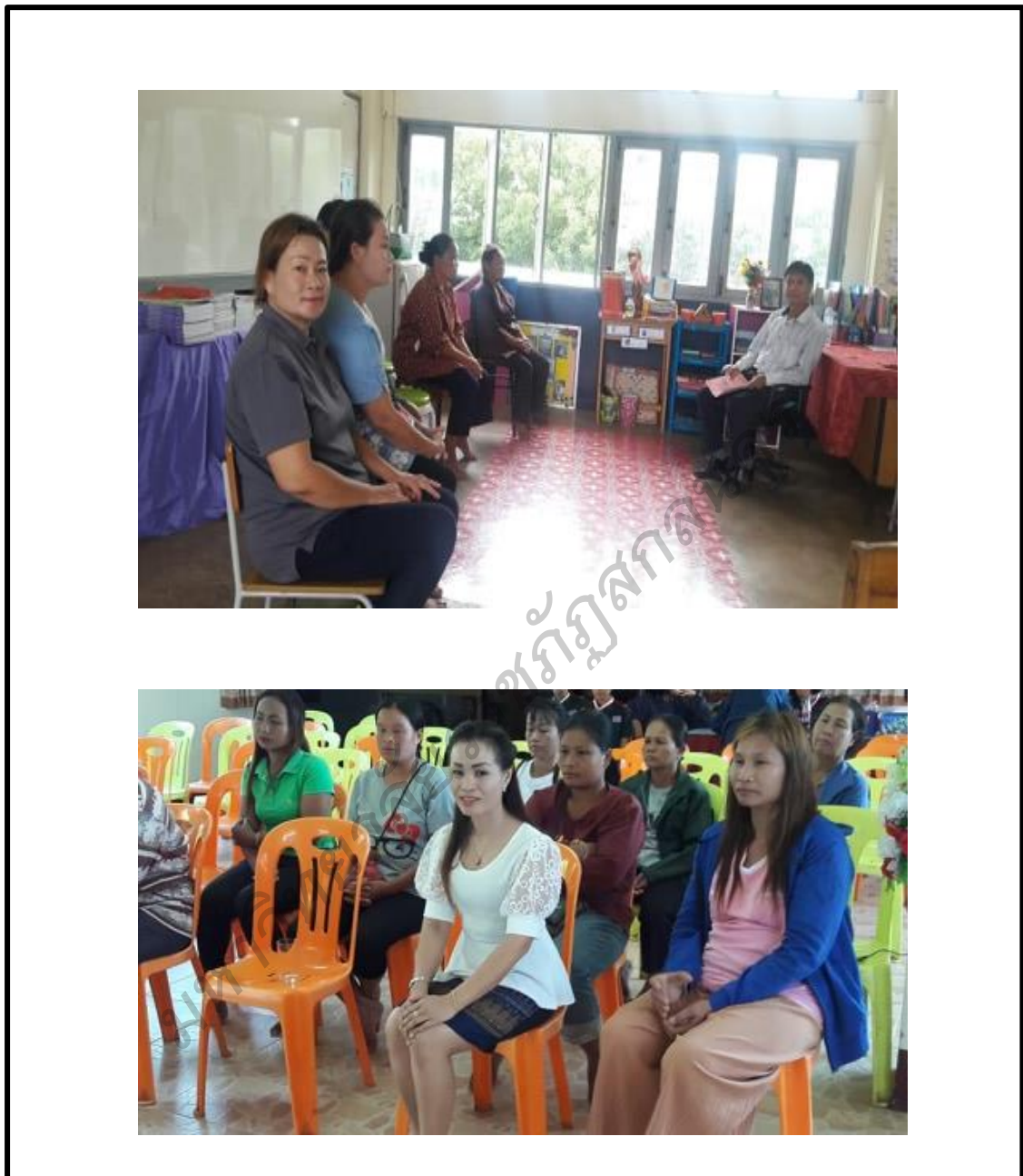
ภาพประกอบ 6 การประชุมชี้แจงคณะกรรมการสถานศึกษาขั้นพื้นฐาน และร่วมกับผู้ปกครอง นักเรียนเพื่อหาข้อมูลนำไป ดำเนินการพัฒนาในการเสริมสร้างวินัยนักเรียน