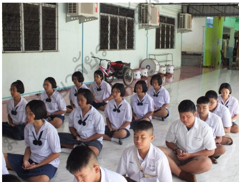
ภาพประกอบ 13 กิจกรรมพัฒนาผู้เรียนส่งเสริมคุณธรรม การนั่งสมาธิ