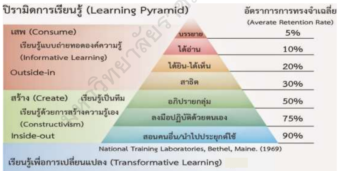
ภาพประกอบ 2 พีระมิตการเรียนรู้

นอกจากนี้แล้ว แนวคิดพีระมิตการเรียนรู้ (Learning Pyramid) ที่สถาบัน NTL Institute for Applied Behavioral Science ได้เสนอข้อมูลที่สามารถนำมาช่วยในการขยาย ความเข้าใจเกี่ยวกับการจัดการเรียนรู้เชิงรุก ซึ่งมีความแตกต่างไปจากการเรียนรู้แบบเป็น ผู้รับ (Passive Learning) อันเป็นหลักของการจัดการเรียนรู้ในอดีตที่เน้นครูเป็นศูนย์กลาง (Teacher-Centered) ซึ่งเคยมีประสิทธิภาพและประสิทธิผลในอดีตที่ผ่านมาโดยให้ความสำคัญ กับการฟัง การอ่าน การได้ยิน ได้เห็น รวมทั้งการสาธิตของครูผู้สอน แนวทางการจัดการ เรียนรู้ดังกล่าวจะอยู่ยอดของพีระมิต แสดงให้เห็นว่าผู้เรียน เรียนรู้จากการถ่ายทอด เป็นส่วนใหญ่ซึ่งแตกต่างไปจากการเรียนรู้ผ่านการอภิปรายแลกเปลี่ยน การลงมือปฏิบัติ และนำความรู้ไปใช้ รวมทั้งการแลกเปลี่ยนเรียนรู้ผู้อื่นเป็นแนวทางที่เน้นผู้เรียนเป็นสำคัญ (Student-Centered) และสะท้อนให้เห็นว่านักเรียนสามารถสร้างความรู้ได้แล้วอยู่ที่ส่วนฐาน ของพีระมิต ดังภาพประกอบ 2 (วัชรา เล่าเรียนดี และคณะ, 2560, หน้า 65)