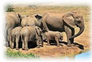
โขลงช้าง