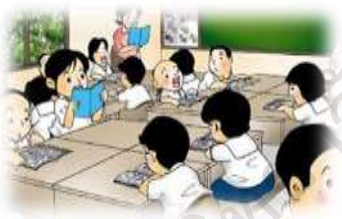
กลุ่มนักเรียน