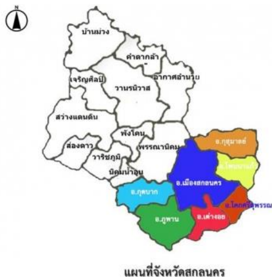
ภาพประกอบ 1 การแบ่งเขตอำเภอในจังหวัดสกลนคร