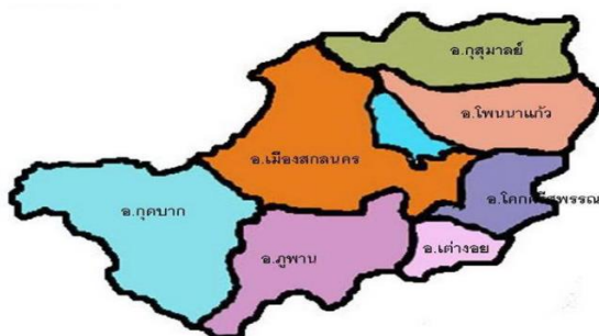
ภาพประกอบ 2 เขตพื้นที่รับผิดชอบของสำนักงานเขตพื้นที่การศึกษาประถมศึกษาสกลนคร เขต 1