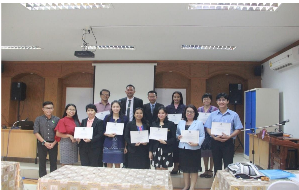
ภาพประกอบ 10 ครูผู้สอนวิชาภาษาอังกฤษ เข้ารับการอบรม “รูปแบบการพัฒนาภาวะ ผู้นำทางวิชาการสำหรับครูผู้สอนวิชาภาษาอังกฤษระดับมัธยมศึกษา ภาค ตะวันออกเฉียงเหนือ”