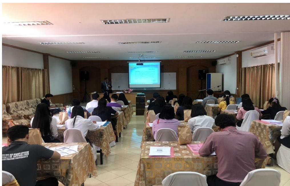
ภาพประกอบ 7 ครูผู้สอนวิชาภาษาอังกฤษ เข้าร่วมการอบรม “รูปแบบการพัฒนาภาวะผู้นำ ทางวิชาการสำหรับครูผู้สอนวิชาภาษาอังกฤษระดับมัธยมศึกษา ภาคตะวันออกเฉียงเหนือ”