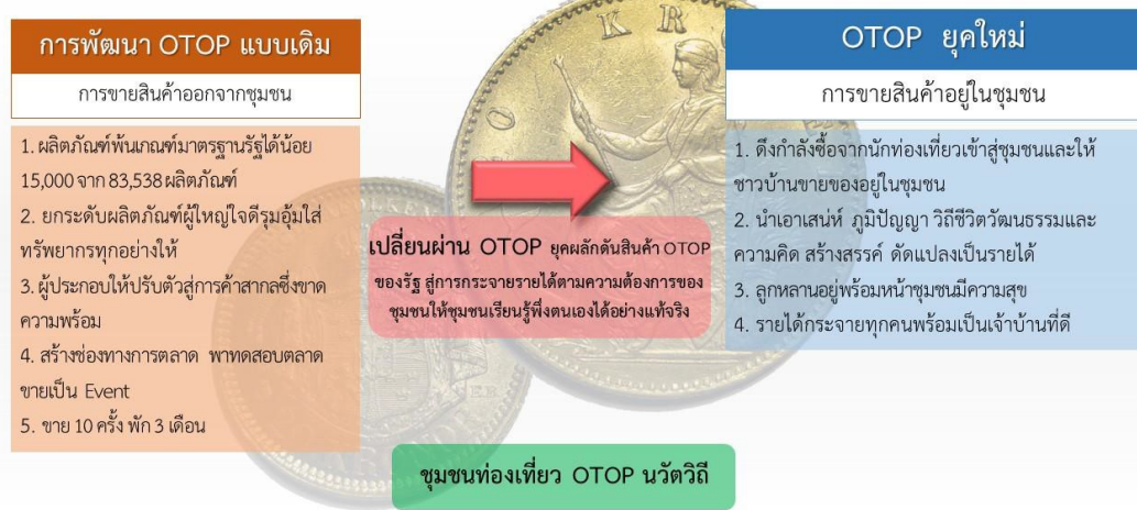
ภาพประกอบ 2 แนวคิดการพัฒนา OTOP รูปแบบใหม่ (ที่มา : กรมการพัฒนาชุมชน กระทรวงมหาดไทย, 2561)