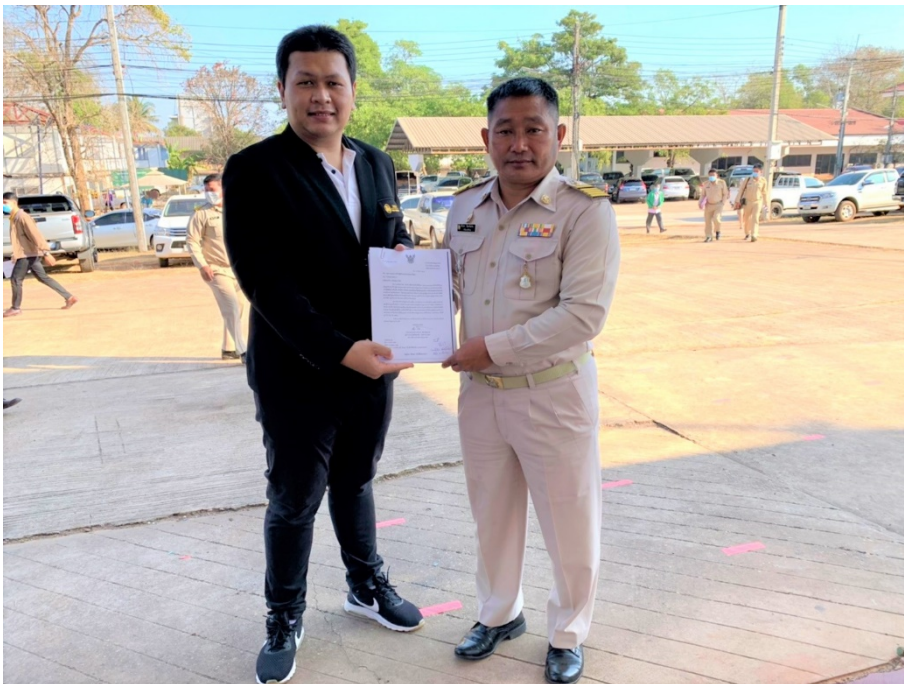
ภาพประกอบ 4 การสัมภาษณ์เพื่อหาแนวทางการพัฒนาการจัดบริการสวัสดิการสังคม ตามแผนพัฒนาท้องถิ่นขององค์การบริหารส่วนตำบลในอำเภอรามบุรี จังหวัดสกลนคร