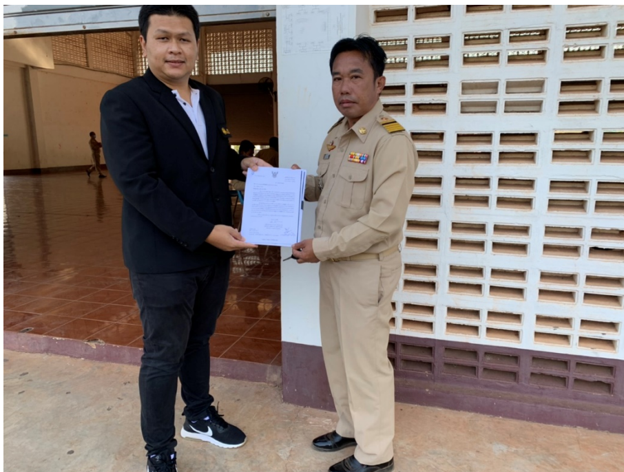
ภาพประกอบ 6 การสัมภาษณ์เพื่อหาแนวทางการพัฒนาการจัดบริการสวัสดิการสังคม ตามแผนพัฒนาท้องถิ่นขององค์การบริหารส่วนตำบลในอำเภอรามัญ จังหวัดสกลนคร